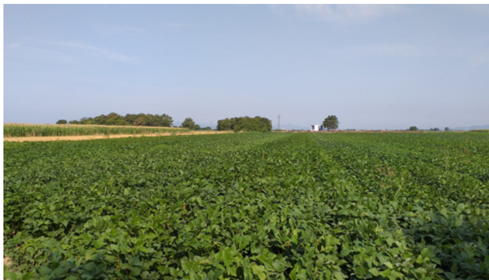
Pogled na pokus