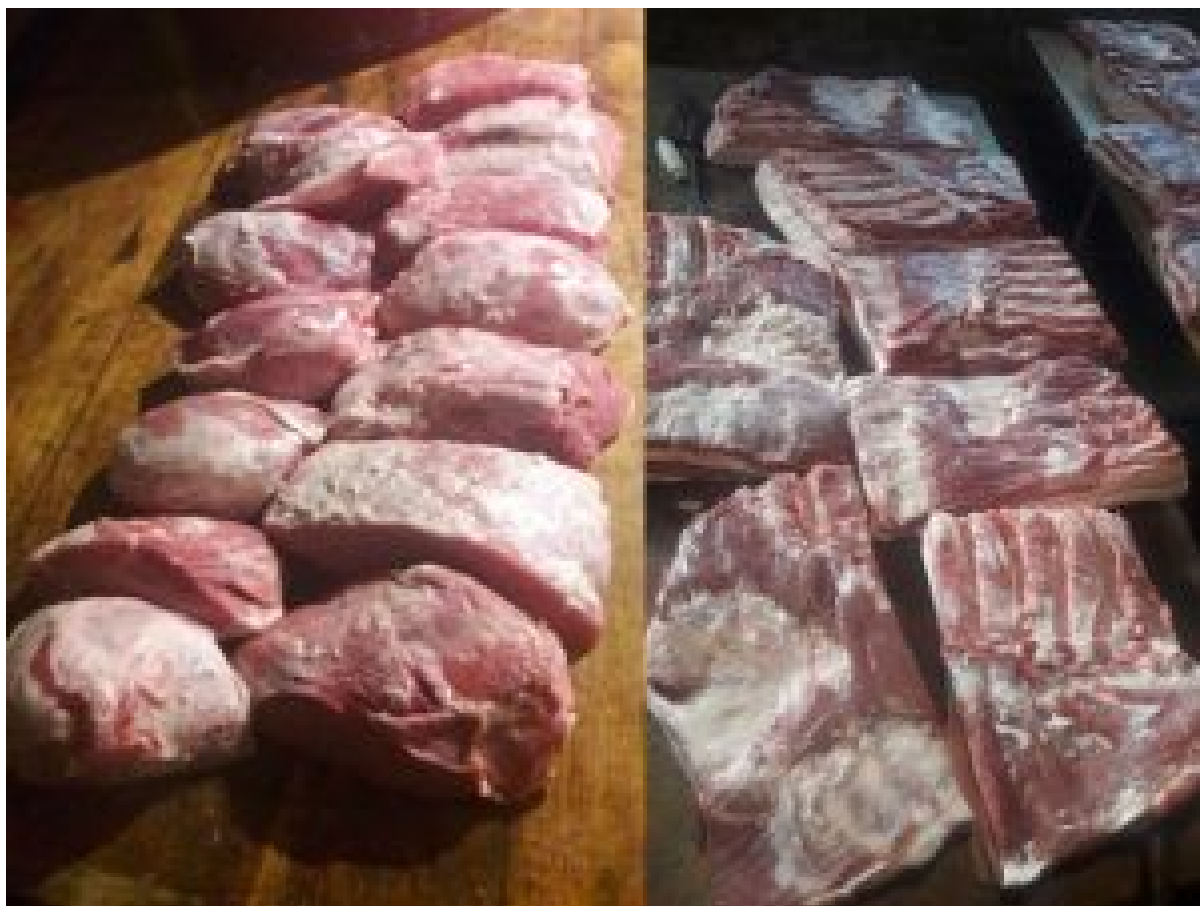
Produženim tovom možemo postići veliku količinu vrhunskoga mesa za preradu