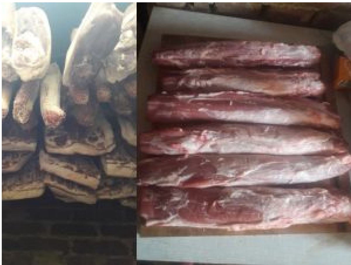
Najkvalitetnije dijelove mesa pretvaramo u prave delicije