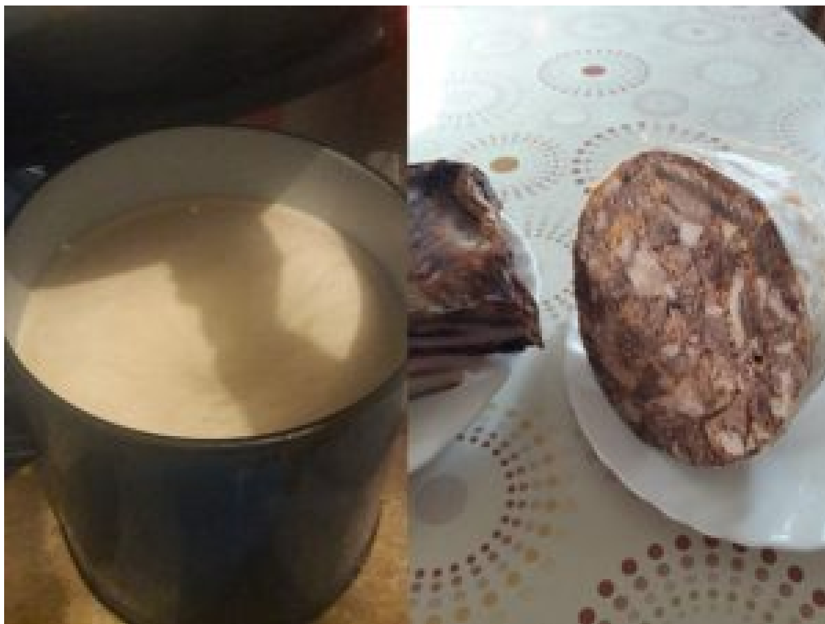
Domaća svinjska mast i švargl

Za kvalitetnu domaću šunku, kulen, slaninu, kobasice, čvarke i svinjsku mast važno je odabrati određene pasmine ili križance, imati kvalitetnu hranidbu i što prirodnije uvjete držanja. Produženim tovom križanih svinja (kod nas tri ili četiri pasmine) dobivamo kvalitetne svinje s velikom količinom i odličnom kvalitetom mesa za daljnju upotrebu.