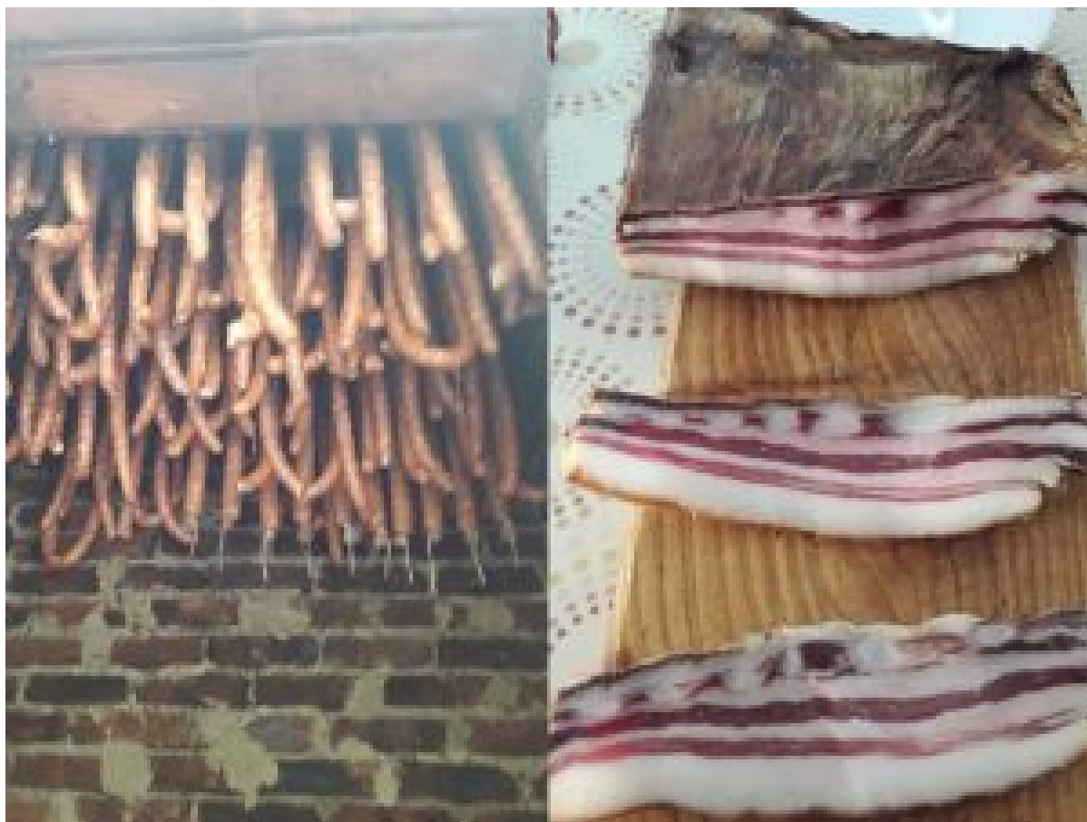
Tradicijski suhomesnati proizvodi imaju „šmek“ koji se ne može naći kod industrijskih proizvoda