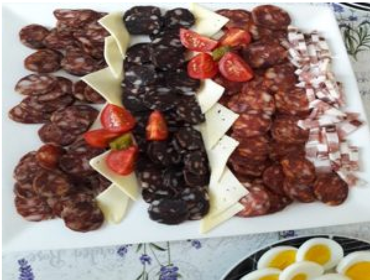
Domaće je domaće ...

U proizvodnji svinjskog mesa i masti na manjim obiteljskim gospodarstvima ključni je odabir dobre genetike koja ima potencijal da se može postići ono što se želi. Na tome treba posebno raditi jer uzgoj i genetsko unaprjeđenje je malo dugotrajniji proces, gdje struka i znanost moraju dati prava rješenja.